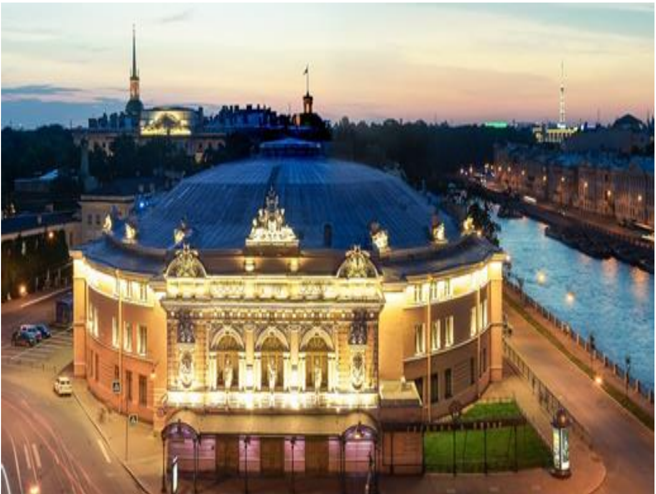
Цирк на Фонтанке

2. Рассмотрите картинку цирка в нашем городе на Фонтанке и цирка-шапито. Цирк - это всегда праздник, всегда парад ловкости, силы, юмора!