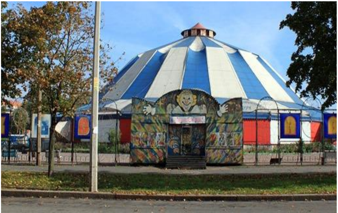
Цирк-шапито в Автово.

3. А кто работает на арене цирка. Отгадай загадки: